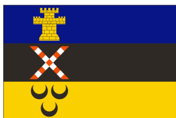
De gemeentevlag van Meierijstad.

Ook het hijsen van de nieuwe gemeentevlag was een bijzondere gebeurtenis omdat PEM betrokken was bij het adviseren over het ontwerp.